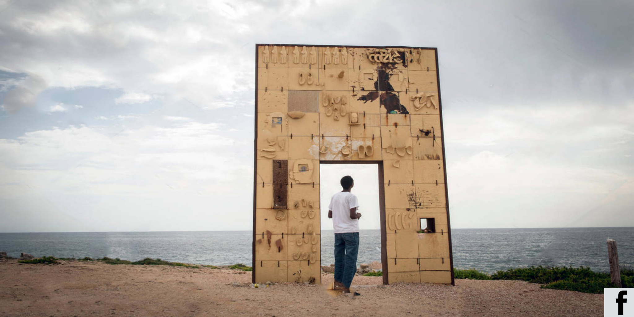
— LAMPEDUSA, SICILIA, 2013. MIGRANTE ERITREO PRESSO IL MONUMENTO “LA PORTA D’EUROPA”

“Il fenomeno migratorio, in Italia come in Europa, è ancora fortemente legato alla retorica dell’emergenza. Le politiche migratorie muovono nella direzione del controllo delle frontiere, dei transiti e delle persone sul territorio.