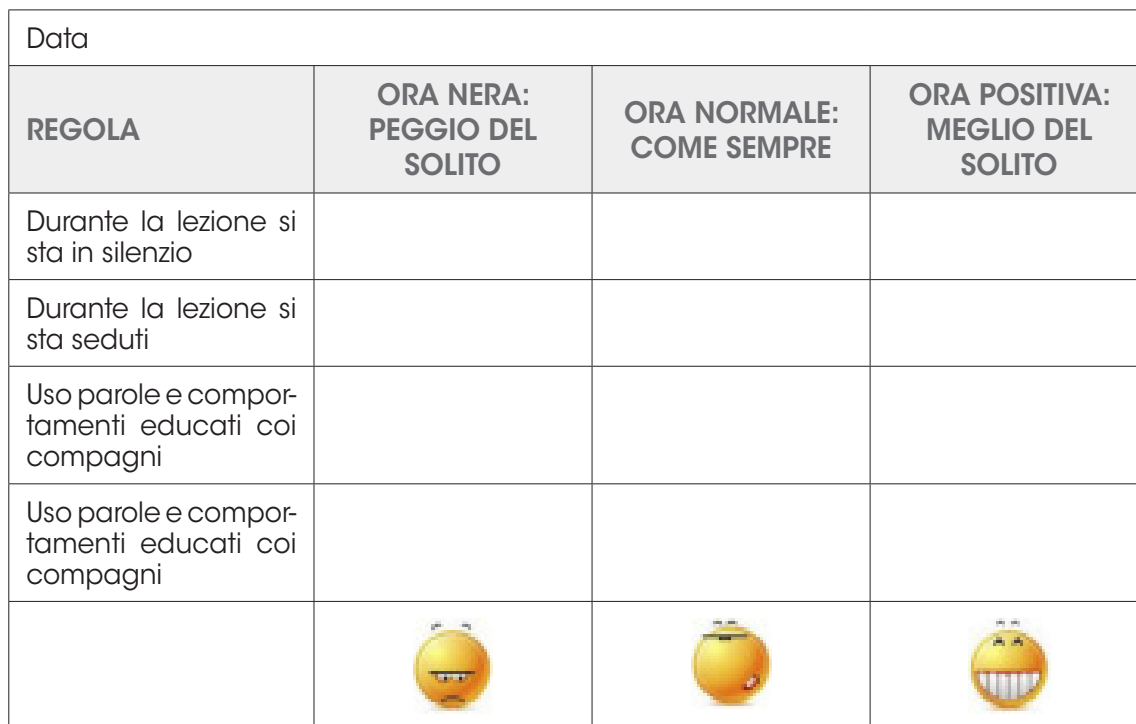
TABELLA 3 Scheda di autovalutazione che i bambini compilavano alla fine dell'ora

In seguito al monitoraggio di metà percorso è stata introdotta ai bambini una scheda di autovalutazione (Tabella 3).