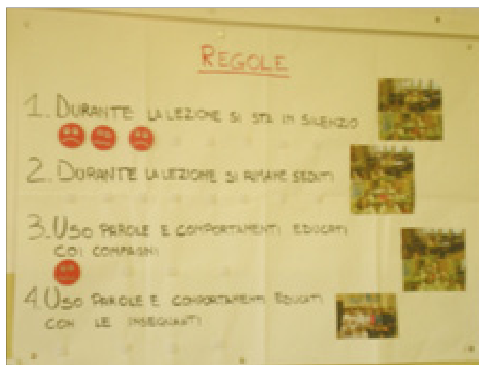
Fig. 1 Il cartellone delle 4 regole.

ciascun bambino che avesse rispettato le regole e il bambino avrebbe potuto attaccarlo sul cartellone in parte al proprio nome (Figura 2).