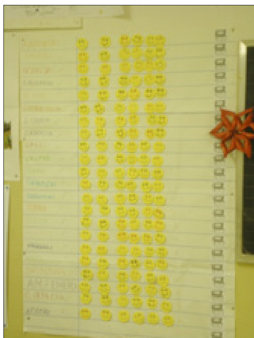
Fig. 2 Cartellone con i token ottenuti dai bambini.

ciascun bambino che avesse rispettato le regole e il bambino avrebbe potuto attaccarlo sul cartellone in parte al proprio nome (Figura 2).